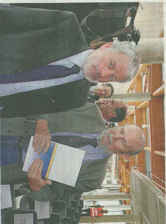
VISITA A CONA

IL MAGNIFICO rettore dell'università di Ferrara, di cui si è più volte fatto il nome anche per la vicepresidenza, sembra avere perso terreno. A sbarrargli il cammino sarebbe la sua matrice franceschiniana. Per un ruolo da 'semplice' assessore la strada resta parzialmente aperta, anche se bisogna vedere se deciderà di accettare. Sembra invece completa-