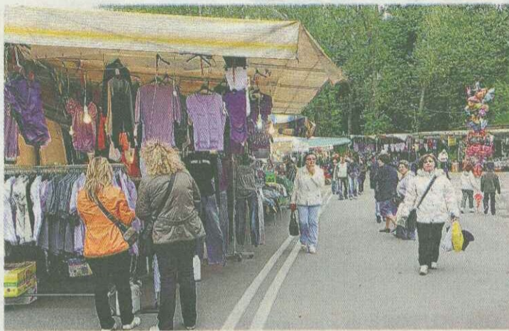
MODIFICHE Cambia anche la viabilità nella zona del Montagnone per la Fiera di San Giorgio