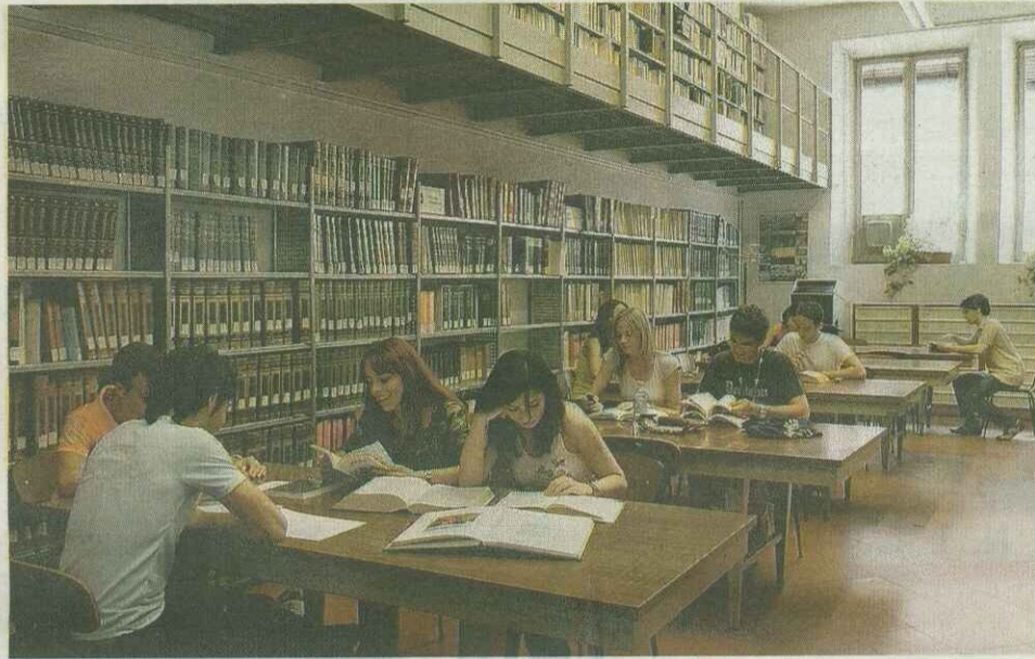
Sono migliaia gli studenti che quotidianamente frequentano le biblioteche del «Polo»

ECCO tutti gli appuntamenti dell'Università per la città da lunedì 3 a mercoledì 5 maggio: fino a martedì 15 giugno, Sala Mostre di Palazzo Turchi di Bagno in corso Ercole I d'Este, 32 Mostra L'Orto Botanico di Ferrara ieri, oggi e domani. Dal lunedì al venerdì dalle 9 alle 18. Lunedì 3 alle 16 alla Fondazione Ermitage Italia in c.so Giovecca, 148/a Ciclo di conferenze Caravaggio e i Caravaggeschi. La tecnica di Caravaggio alla luce dei restauri. Relatori: Daniela Storti e Valeria Merlini (Roma) Organizzato dall'Università di Ferrara e dalla Fondazione Ermitage Italia. Martedì e mercoledì all'Aula Magna di Palazzo Renata di Francia in via Savonarola, 9 convegno «Le complicanze in Chirurgia vascolare: casi clinici».