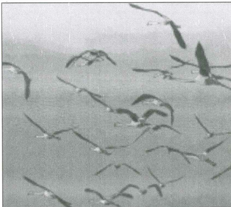
Fenicotteri in volo colti dal magico obiettivo di Lorenzo Vitali L'eccezionale scatto in prima pagina, invece, è di Alessandro Salvini