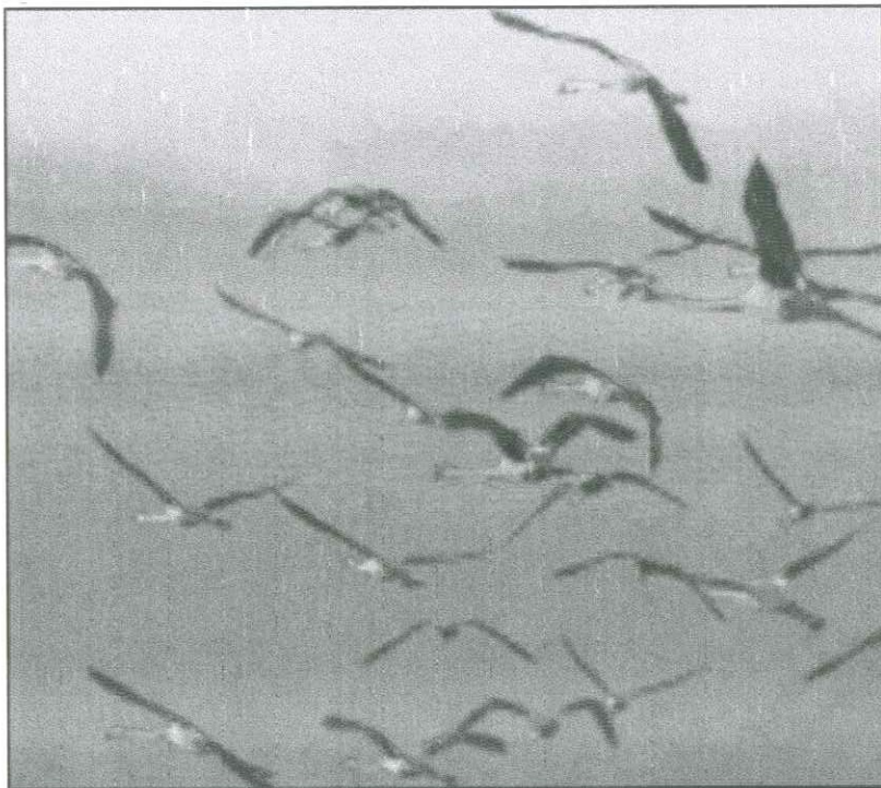
Fenicotteri in volo colti dal magico obiettivo di Lorenzo Vitali L'eccezionale scatto in prima pagina, invece, è di Alessandro Salvini