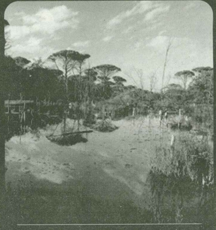
La Pineta di San Vitale, una delle mete di turismo slow

Non si può dunque parlare - ha concluso Gottifredi - di turismo ma di turismi e sappiamo che tra qualche anno la somma delle nicchie dei vari mercati farà la somma generale del mercato turistico. In Emilia - Romagna abbiamo la grande capacità di fare le cose insieme, unendo aree diverse, facendo sistema e valorizzando la grande ospitalità che ci caratterizza e la nostra straordinaria enogastronomia". Al termine della conferenza stampa è stata offerta una degustazione di prodotti tipici del territorio provinciale ferrarese, come anticipazione delle delizie che si potranno gustare visitando l'esposizione della manifestazione e lo splendido scenario naturale che l'ha resa possibile.