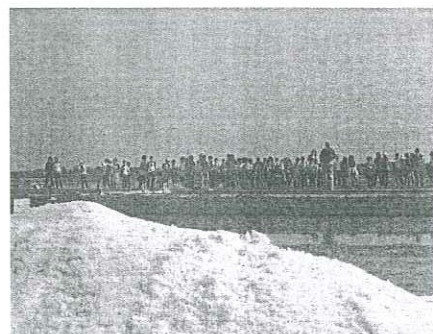
Le saline di Cervia, esempio del connubio uomo-natura

Un territorio dove l'ambiente viene tutelato e rispettato, ma anche goduto in maniere compatibili e appunto "slow": ricco di piste ciclabili, di acque navigabili in battello elettrico per andare alla ricerca degli antichi casoni di pesca in valle, di opportunità per percorsi a cavallo, e naturalmente di infiniti sentieri da percorrere esclusivamente a piedi, perdendosi nel silenzio e nella natura. Il vero denominatore comune del Parco resta comunque l'acqua, ancorché a vari gradi di salinità: dall'acqua del mare alle valli salmastre, lagune, splendidi canneti, per raggiungere infine le oasi naturalistiche di acqua dolce. E dall'acqua, accanto all'acqua, si sono sviluppate nei secoli tutte le attività dell'uomo legate alla pesca, all'agricoltura, alla tradizione, alla cultura, alla storia, all'arte, alla gastronomia. La peculiarità più determinante del Parco è infatti il continuo trasformarsi del connubio uomo-natura: un legame che ha reso possibile, all'interno di un