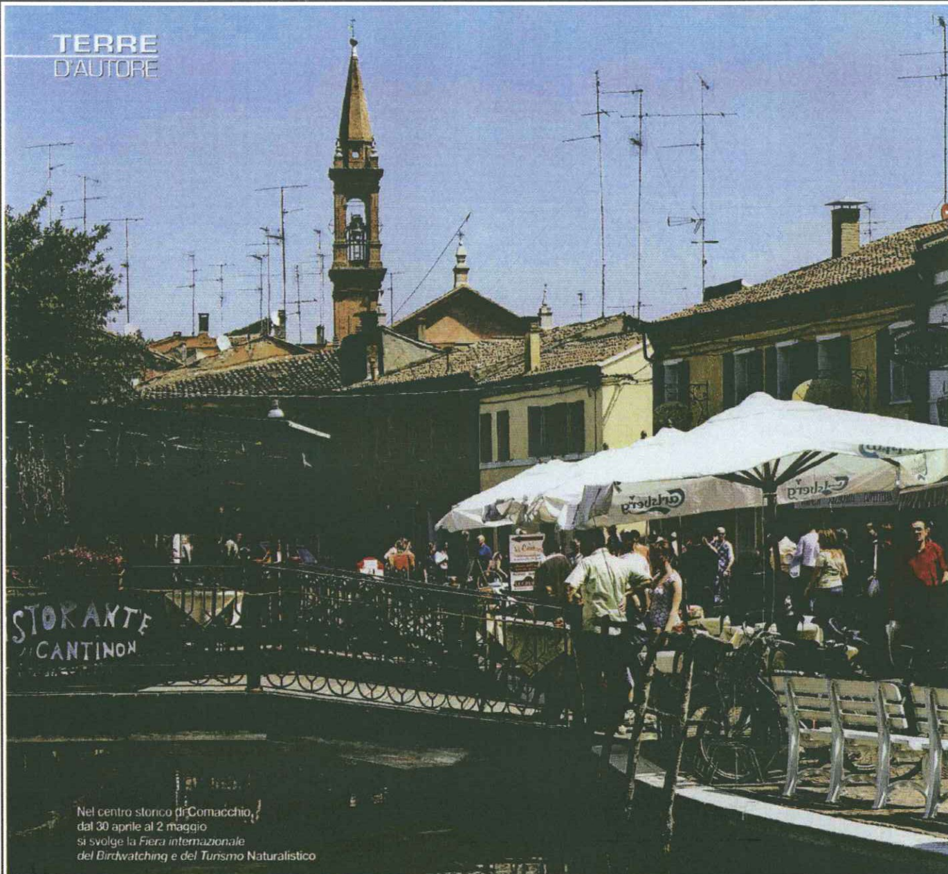
Nel centro storico di Comacchio, dal 30 aprile al 2 maggio si svolge la Fiera internazionale del Birdwatching e del Turismo Naturalistico

dunque questo evento unico in Italia, con un rinnovato villaggio espositivo, che ospiterà le migliori aziende dei settori dell'ottica e fotografia, editoria, abbigliamento sportivo, le più importanti destinazioni naturalistiche, i Parchi e le associazioni dedicate alla natura. Le tre giornate saranno arricchite da vari eventi collaterali: escursioni, lezioni di birdwatching , mostre e workshop di fotografia naturalistica, convegni, seminari e laboratori didattici. Torneranno, inoltre, i concorsi di fotografia Delta in focus , dedicato ai migliori scatti naturalistici dell'avifauna del Delta e del mondo, e Digiscoping nel Delta , dedicato a tutti i fotografi che utilizzano questa particolare tecnica fotografica. Nell'ambito della Fiera si terrà il Festival