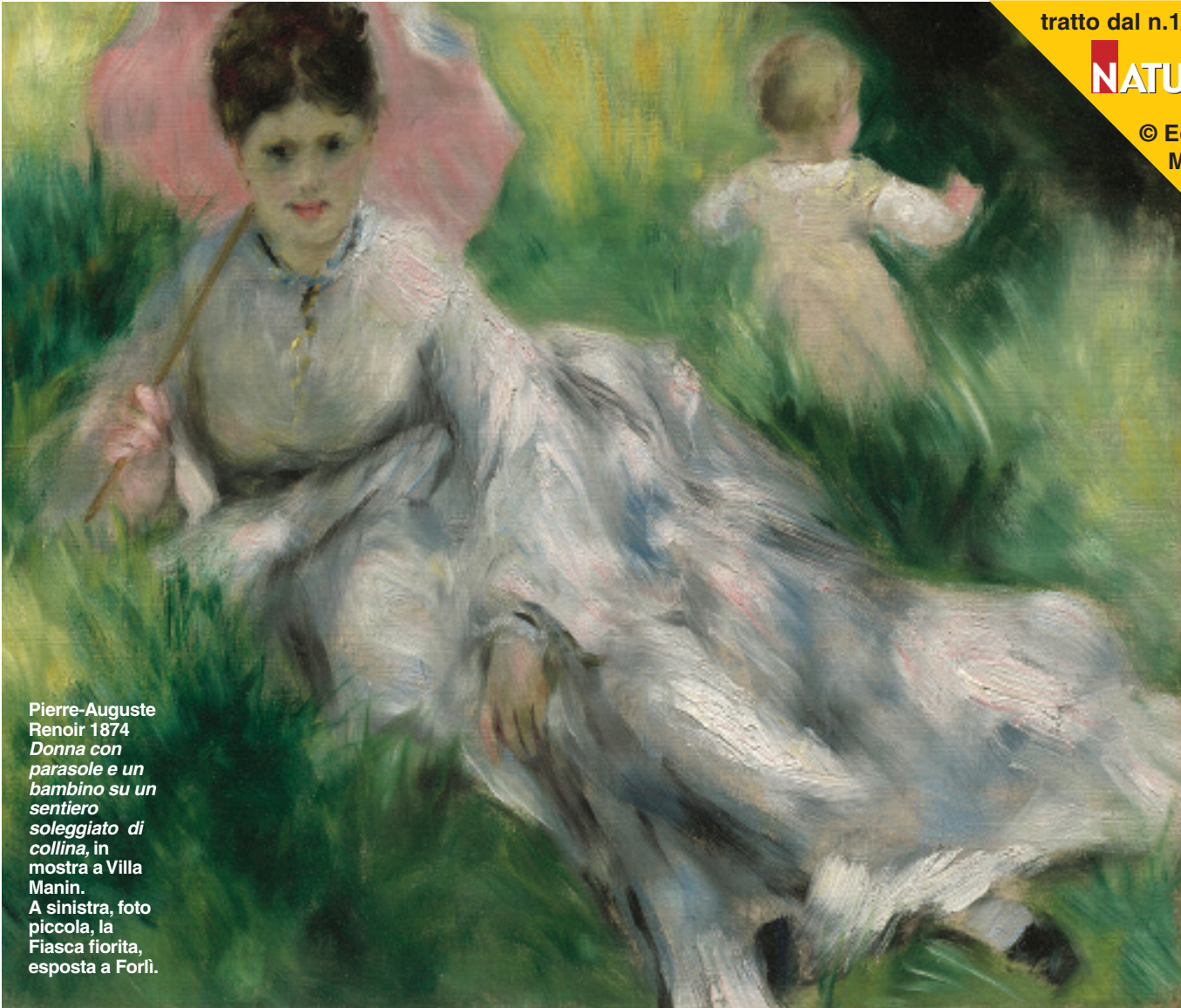
Pierre-Auguste Renoir 1874 Donna con parasole e un bambino su un sentiero soleggiato di collina , in mostra a Villa Manin. A sinistra, foto piccola, la Fiasca fiorita, esposta a Forlì.