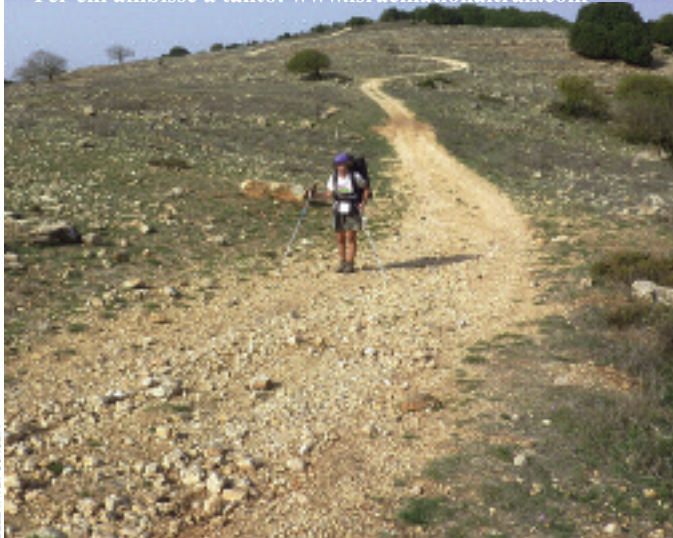
BELLAVITE / SCAGLIA

Per chi ambisse a tanto: www.israelnationaltrail.com