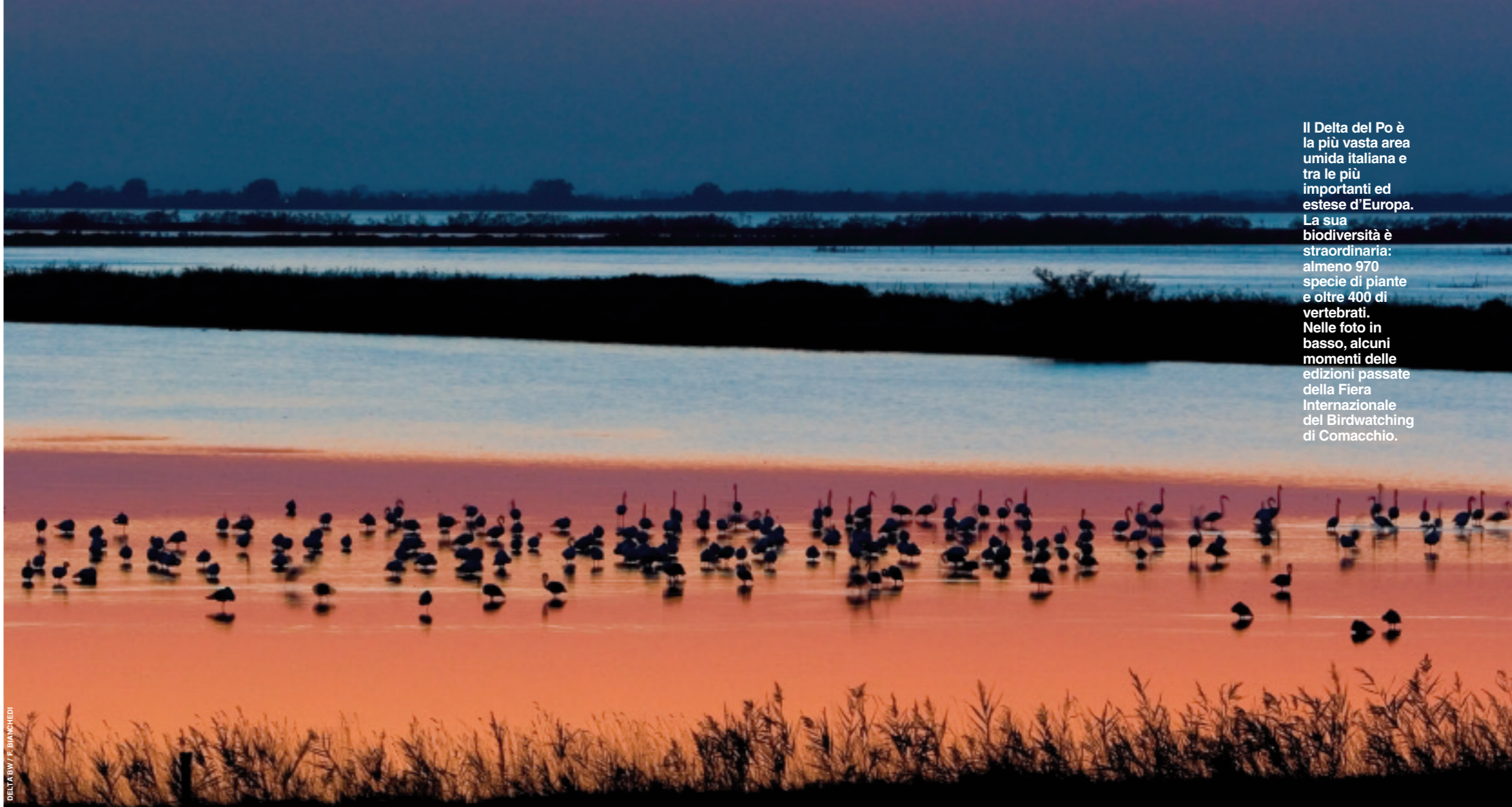
DELTA BW / F. BIANCHEDI

Ogni giorno dalle 10 alle 19, presso l'argine Valle Fattibello, i padiglioni espositivi apriranno le porte agli appassionati di birdwatching, ma non solo. Infatti, oltre a toccare con mano strumenti ed equipaggiamenti per osservare e fotografare la natura, ci si potrà muovere tra i produttori di arredi per parchi e giardini, salire a bordo degli ultimi modelli di caravan e ▶