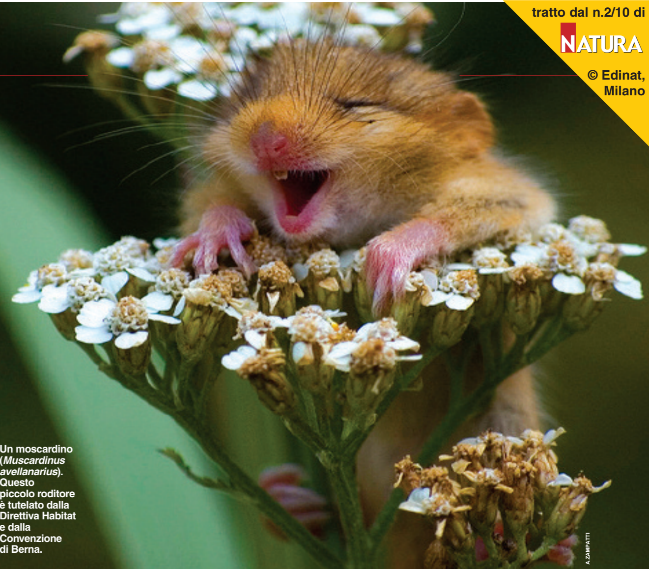
Un moscardino ( Muscardinus avellanarius ). Questo piccolo roditore è tutelato dalla Direttiva Habitat e dalla Convenzione di Berna.

Nell'anno dedicato alla Biodiversità, il Wwf ricorda che l'Italia è il paese d'Europa con il più elevato tasso di varietà: 57.468 specie animali (di cui l'8,6% endemiche) e 12mila specie vegetali (di cui il 13,5% endemiche). Un patrimonio naturale da conservare e proteggere, anche attraverso la costituzione di aree protette. Attualmente, infatti, il 66% delle specie di uccelli, il 64% di mammiferi, il 76% di anfibi e l'88% di pesci d'acqua dolce rischiano di scomparire a causa della modificazione degli habitat, della caccia, del bracconaggio, dell'inquinamento. Insomma: a causa dell'Uomo.