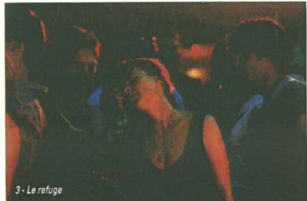
3 - Le refuge