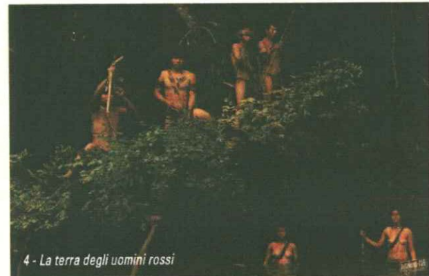
4 - La terra degli uomini rossi