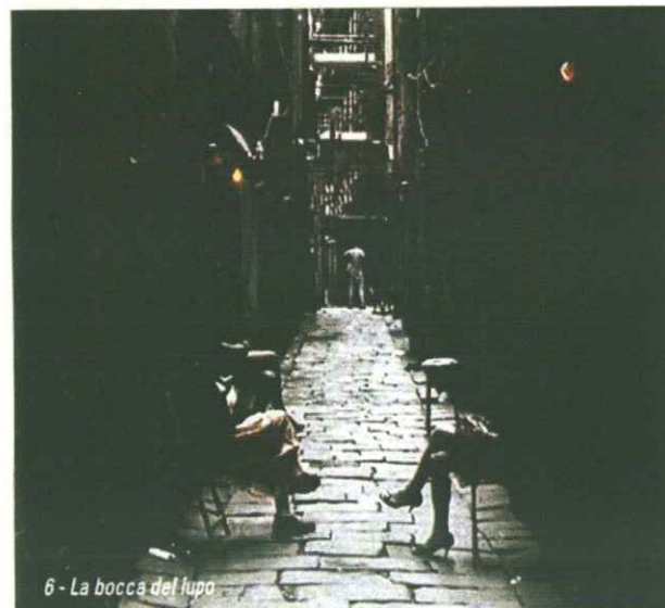
6 - La bocca del lupo