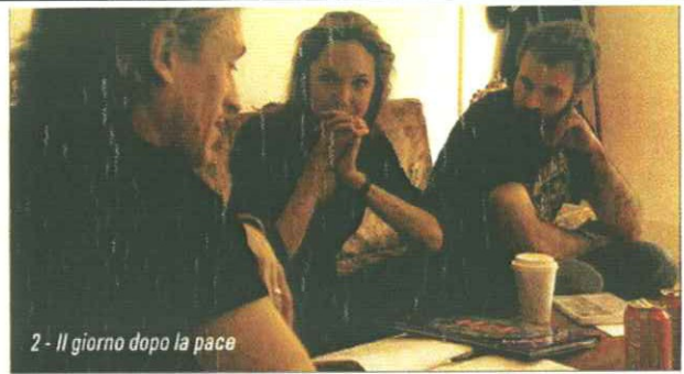
2 - Il giorno dopo la pace