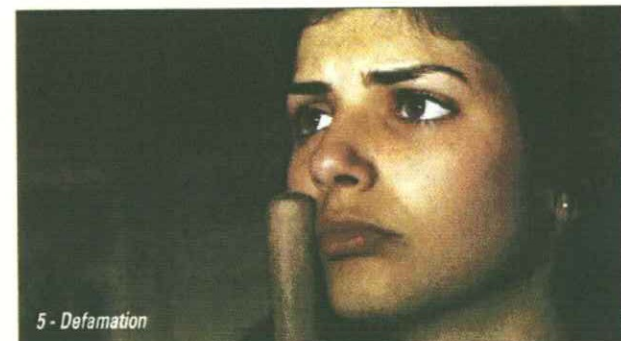
5 - Defamation

Ecco alcune immagini dai maggiori festival di cinema indipendente: 1- Je suis Simon di Fabrizio Ferraro, menzione speciale al Torino Film Festival; 2- Angelina Jolie nel Giorno dopo la pace, presentato a EcoVision di Palermo; 3- Le refuge di François Ozon, Mouse d'argento al Torino Film Festival; 4- La terra degli uomini rossi di Marco Bechis, presentato a Cinema & Ambiente di Roma; 5- il vincitore del Festival dei Popoli di Firenze, Defamation di Yoav Shamir; 6- La bocca del lupo di Pietro Marcello, Mouse d'oro al Torino Film Festival; 7- Cambodian Room di Lusena-Schillaci, premiato sempre a Torino.