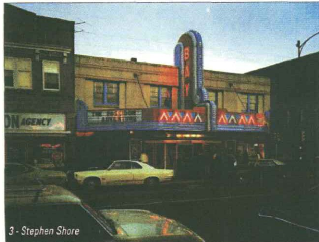
1 e 2 - La Persia Qajar, in mostra a Roma fino al 5 aprile; 3 - Stephen Shore, Second Street, Ashland, Wisconsin, 1973; qui sotto, uno scatto di Robert Mapplethorpe. La mostra è al Museo d'Arte di Lugano, fino al 13 giugno.