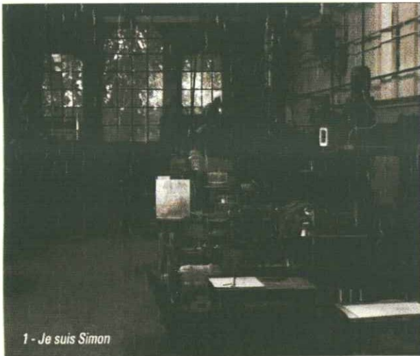
1 - Je suis Simon