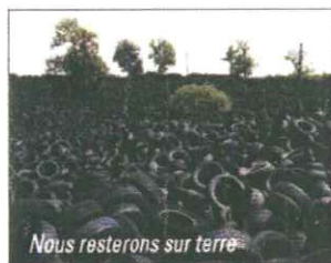
Nous resterons sur terre