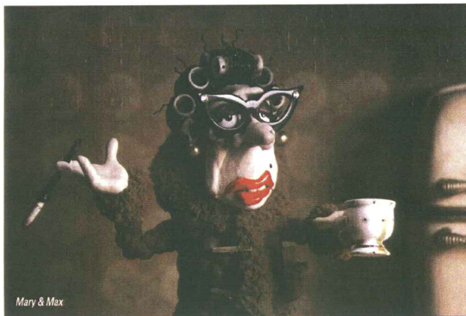
Mary & Max

Spazio ai vincitori dei vari concorsi: in senso orario dall'alto Topi di Arjun Rihan (River to River), Galantuomini di Edoardo Winspeare (Ischia Film Festival 2009), Children di Tom Shankland (Science Fiction), Nous resterons sur terre (CinemAmbiente), La casa sulle nuvole (Claudio Giovannesi, Ischia FF 2009), Samson & Delilah di Warwick Thornton (Asia PSA), Mary & Max di Adam Elliot (Asia PSA), El misterio del pez di Giovanni Maccelli (Acquedolci FF 2009).