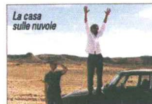
La casa sulle nuvole