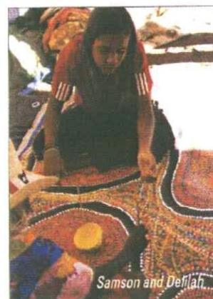
Samson and Delilah