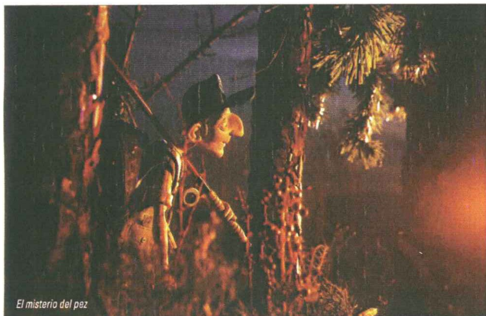
El misterio del pez