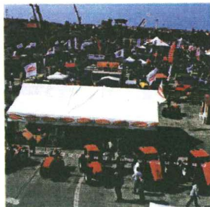
Dal 23 al 26 aprile si svolge, presso il quartiere fieristico di Lanciano (Chieti), la 49ª edizione della «Fiera nazionale dell'agricoltura»

Orario continuato di apertura al pubblico: