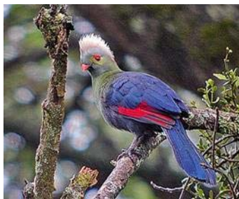
Un esemplare di Turaco

Comacchio. Un'anteprima dedicata alla natura osservata, filmata, scoperta ma anche raccontata e fotografata. Domani a Comacchio un'intera giornata di anticipazione della Fiera Internazionale del Birdwatching e del Turismo naturalistico che aprirà il 30 aprile e fino al 2 maggio i suoi padiglioni espositivi.