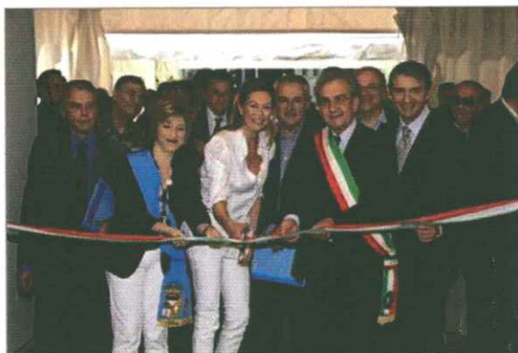
Il taglio del nastro della 5ª Fiera Internazionale del Birdwatching e del Turismo Naturalistico

Comacchio. E' stata la bella giornalista televisiva Tessa Gelisio ad aprire ufficialmente oggi la Fiera Internazionale del birdwatching e del Turismo Naturalistico, il più importante evento italiano dedicato al birdwatching ed al turismo ecosostenibile a contatto con la natura.