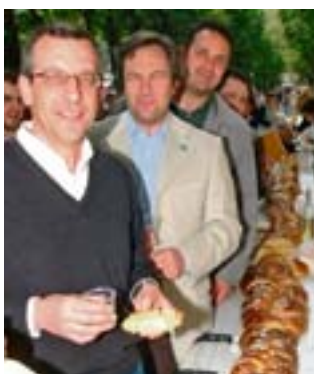
1 maggio, maxi treccia a Piovene

Domenica 27 con il Bicycle project di Vicenza, escursione in mountain bike a Rosolina e Delta del Po. Partenza alle 7.45 con mezzi propri da Vicenza est, ore 9.30 inizio tour, ore 13.30 ristoro a cura del club,