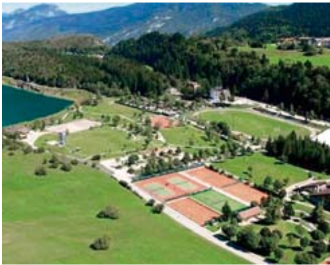
Il complesso sportivo appena fuori dal centro di Andalo

D'inverno, il divertimento è assicurato per gli sciatori: oltre 50 km di piste e impianti nuovissimi. Tra una risalita e l'altra, c'è tempo per ammirare la Valle dell'Adige e le Dolomiti del Brenta. Quando è limpido, si hanno gli sci ai piedi, e si è nei pressi de La Roda (rifugio