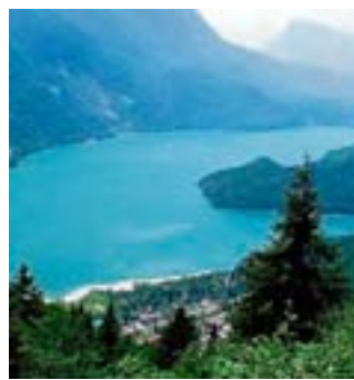
Il lago di Molveno

Paganella per questo periodo. Gli sportivi scelgono Andalo (1040 mt) o Molveno. Ad Andalo si trova infatti un importante centro sportivo polivalente: piscina coperta olimpionica, pallazzetto del ghiaccio e campi da tennis, calcio, pallavolo e pallacanestro, pareti naturali e artificiali di roccia e parchi giochi, minigolf, bocciodromo. Ancora, corsi di arrampicata e percorsi di orienteering, e per gli amanti del brivido i voli in parapendio. Naturalmente, sono innumerevoli i sentieri e i circuiti da percorrere in sella ad una mountain bike. A Molveno c'è il lago (il secondo del Trentino per estensione). Corsi di windsurf, barca a vela e canoa, magari in compagnia