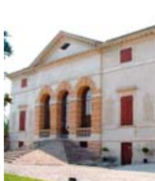
Animazione a villa Caldogno

vitigni e sapori" con le cantine del territorio che esporranno i loro prodotti. Al mattino una passeggiata per i colli di Alonte con il supporto della Guardia Forestale; in piazza S. Savina, con esposizione di vini, olio, formaggio, pane. Info 0444 638188, 334 7526214.